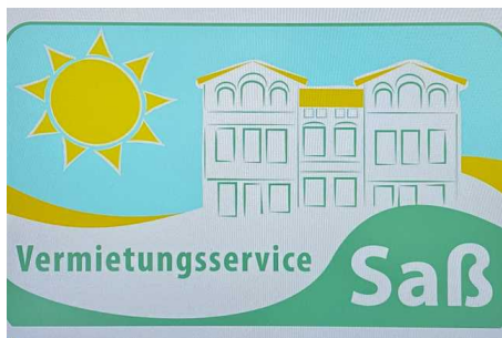
Objekt ID: 19527